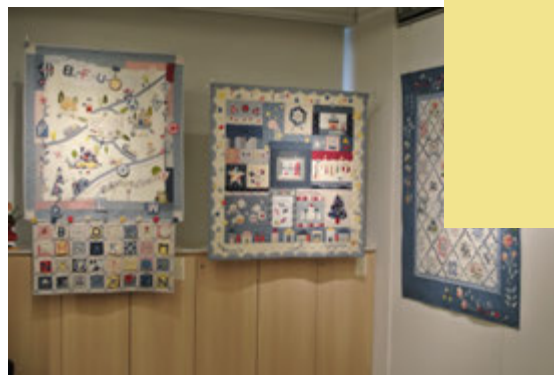
クラフティングアートギャラリーでの展示会の様子